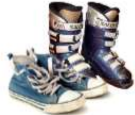
Textiles et chaussures hors d'usage ou souillés.