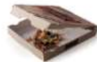
Papiers et cartons souillés, tels que mouchoirs, papier de ménage, cartons de pizza.