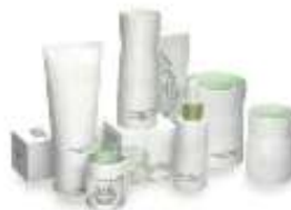
Emballages de lessive, pots de crème et de cosmétiques.