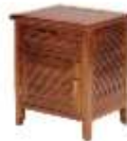
petit mobilier, objets divers jusqu'à 60 cm