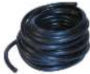
Éléments en caoutchouc, tuyaux de jardin.