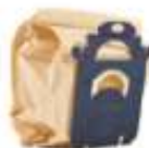
Sacs d'aspirateurs, déchets de nettoyage.