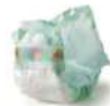
Couches-culottes, serviettes, tampons hygiéniques.