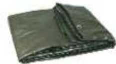
Bâches et films plastiques utilisés pour les travaux, la peinture.