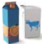
Berlingots de lait ou de jus de fruits en carton plastifié.