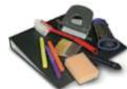
Produits d'hygiène tels que coton-tiges, lingettes, brosse-à-dents, éponges.